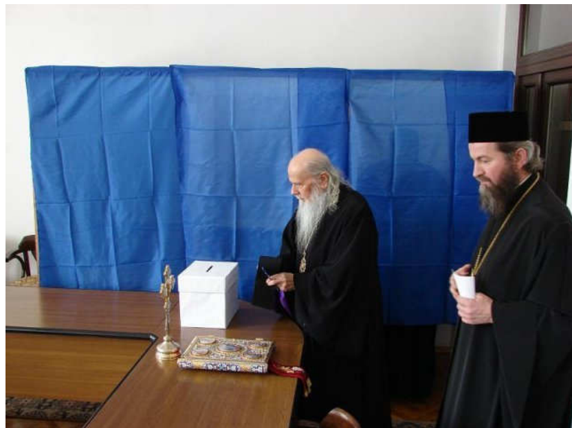
Ierarhii maramureșeni exprimându-și votul bisericesc