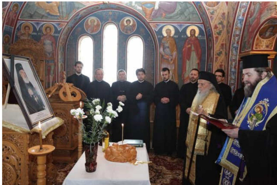
Slujbă de pomenire a Î.P.S. Mitropolit BARTOLOMEU la centrul eparhial al Episcopiei Maramureșului și Sătmăruului