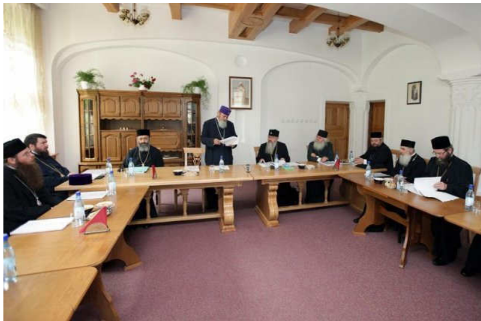
Momente din cadrul lucrărilor Sinodului mitropolitan