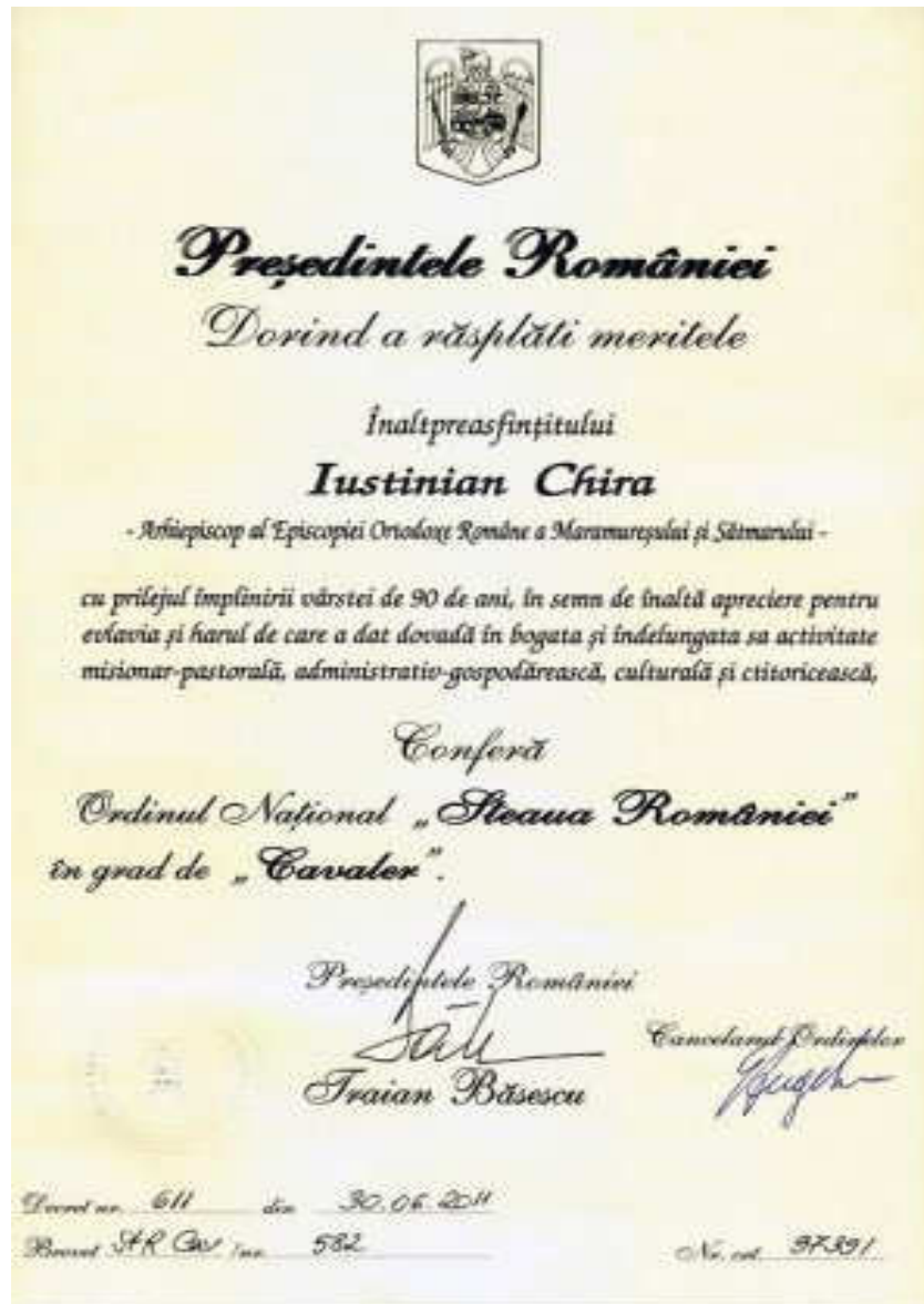
Ordin Național din partea Președintelui României Traian BĂSESCU