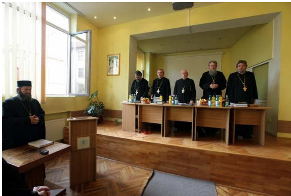
Susținerea tezei de doctorat (25 noiembrie 2011)