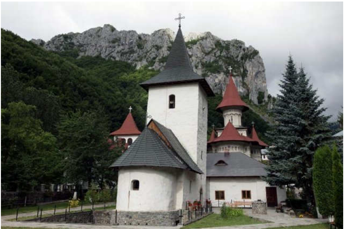
Mănăstirea Râmeț, Jud. Alba