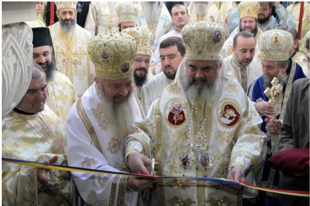
PF Părinte Patriarh DANIEL și membrii Sf. Sinod prezenți la manifestări