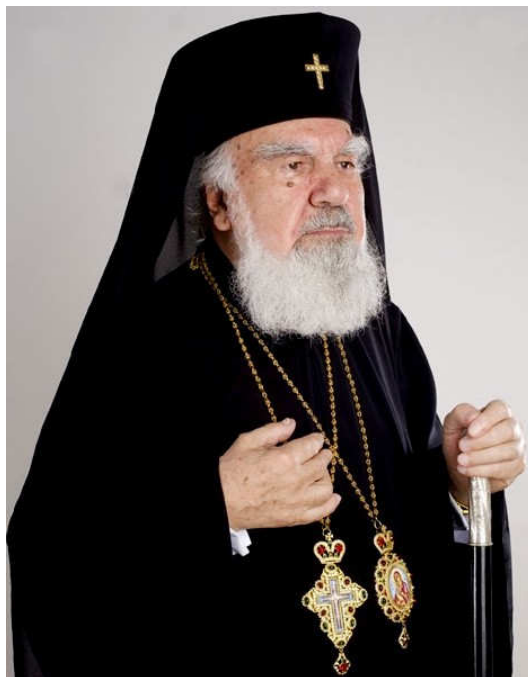
Î.P.S. Mitropolit BARTOLOMEU ANANIA