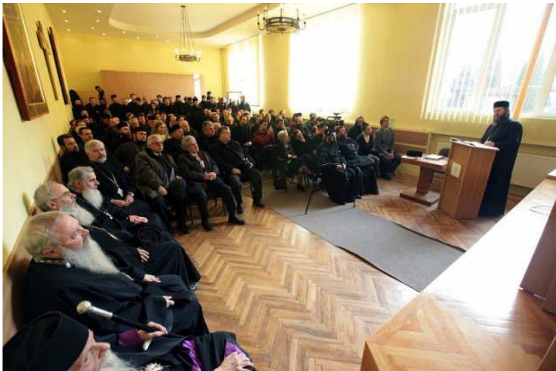
Momente din timpul susținerii doctoratului în sala „Nicolae Ivan” (Cluj-Napoca)