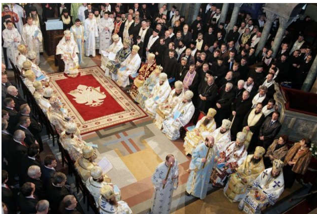
Moment din cadrul solemn al Sfintei Liturghii