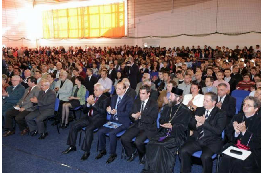
Imagini de la deschiderea oficială a noului an universitar 2011-2012