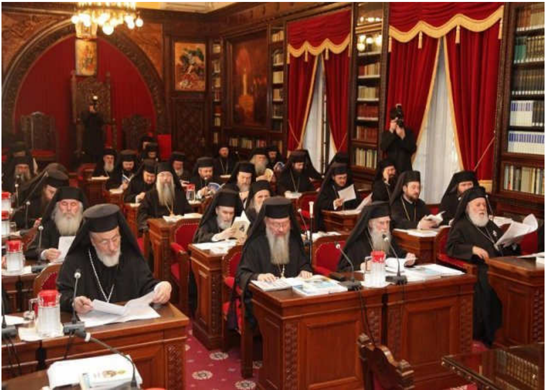
Imagini din cadrul ședinței Sfântului Sinod (18 martie 2011)