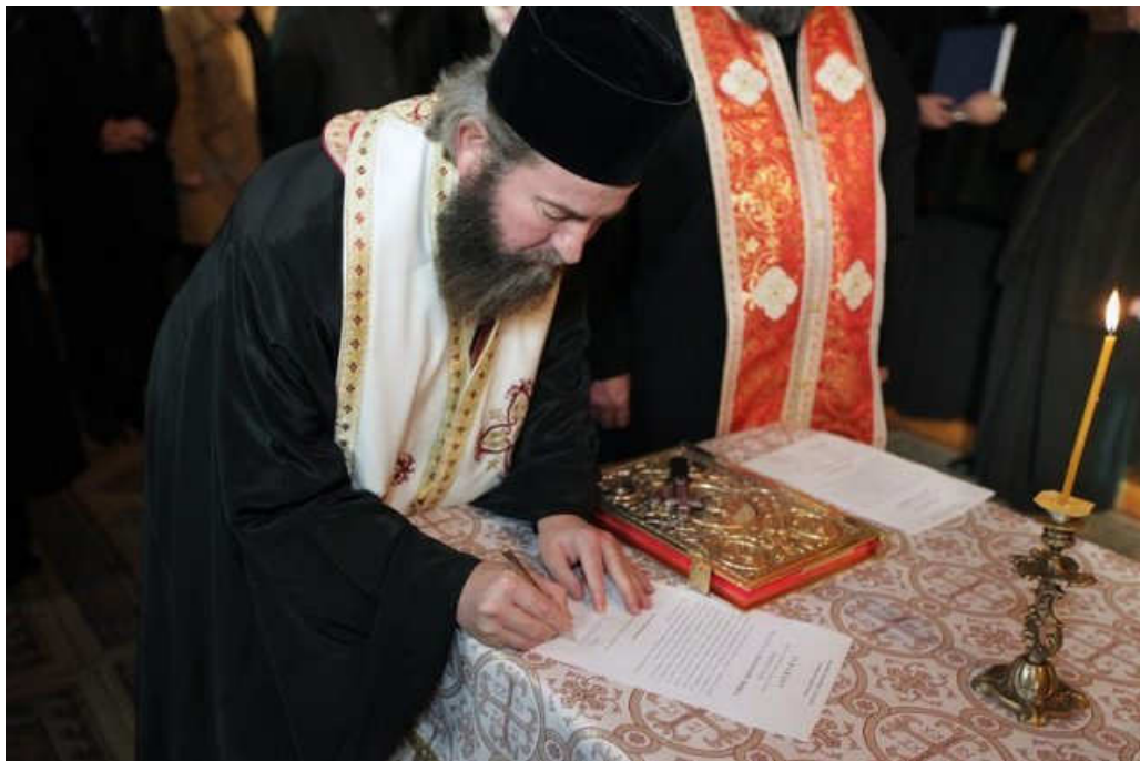
Moment important de depunere a jurământului în calitate de „doctor în Teologie”