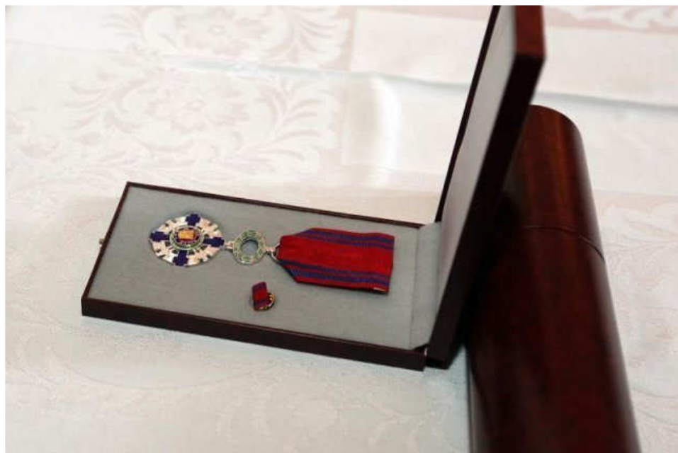
Înaltpreasfinției Sale Justinian Chira - arhiepiscopul ortodox al Maramureșului și Sătmărilor – i s-a conferit ordinul " Steaua României în grad de cavalier " (7 iulie 2011)