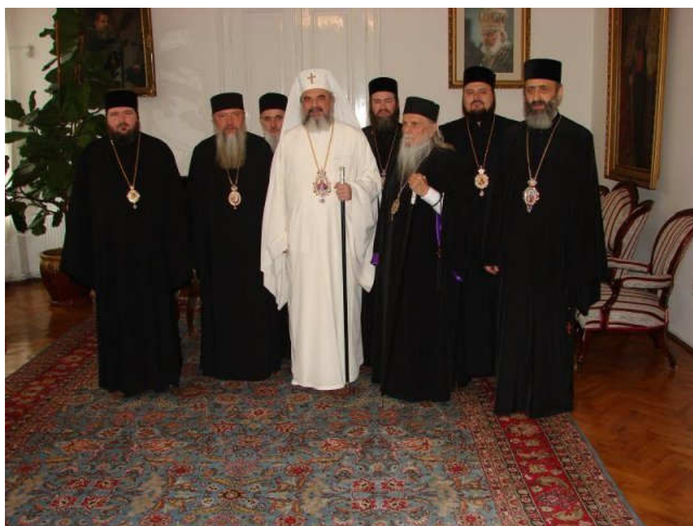
P.F. Părinte Daniel –Patriarhul BOR alături de membrii Sinodului mitropolitan al Mitropoliei Clujului, Albei, Crișanei și Maramureșului

noului Centru eparhial din Zalău. Pentru o reflectare completă a vieții religioase la nivelul întregi Mitropolii a Clujului, Albei, Crișanei și Maramureșului, eparhiile componente, își vor intensifica, pe viitor, cooperarea cu Centrul de presă Basilica al Patriarhiei Române. Colaborarea cu Patriarhia Română va include și implementarea în Eparhiile Mitropoliei Clujului a programelor catehetice-sociale „ Hristos împărtășit copiilor ” și „ Alege școala ”.