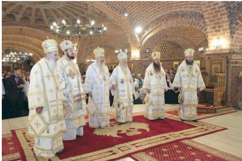
Imagini din cadrul Sfintei Liturghii –sărbătorirea a 90 de ani de viață