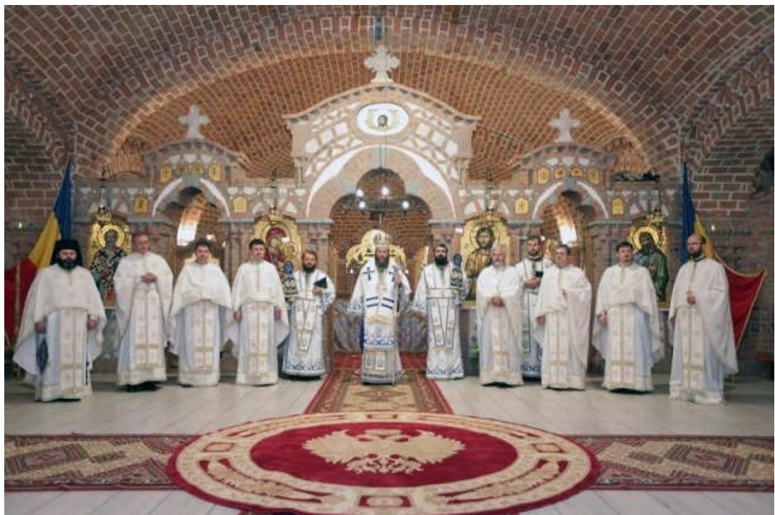
Imagini de la Sf. Litughie de început de an universitar 2011-2012