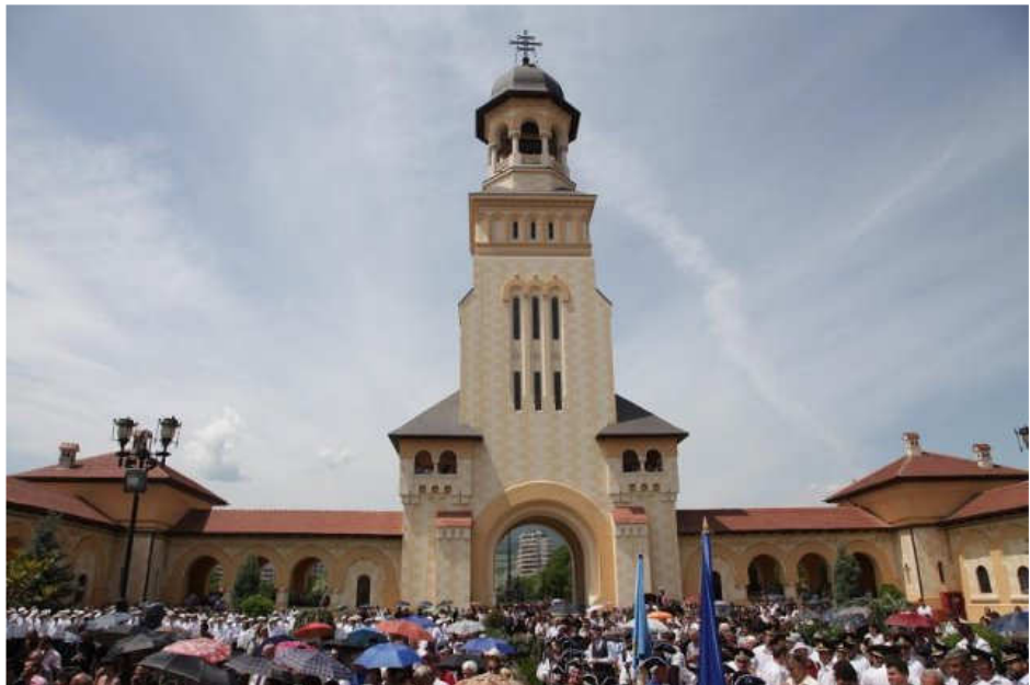
Moment solemn al intronizării Î.P.S. Arhiepiscop IRINEU