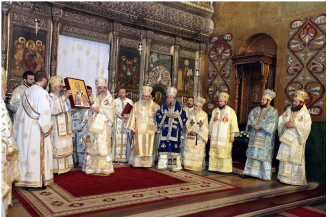
Moment festiv din cadrul Sfintei Litughii