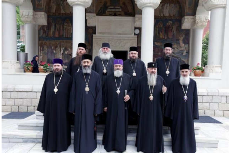
Membrii Sinodului mitropolitan al Ardealului și al Clujului, Albei, Crișanei și Maramureșului