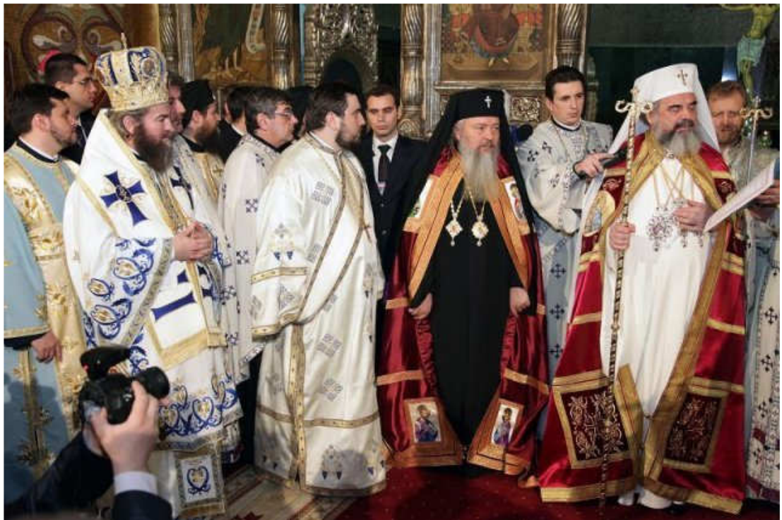
Moment al intronizării ÎPS Mitropolit ANDREI 25 martie 2011 (de Buna Vestire )