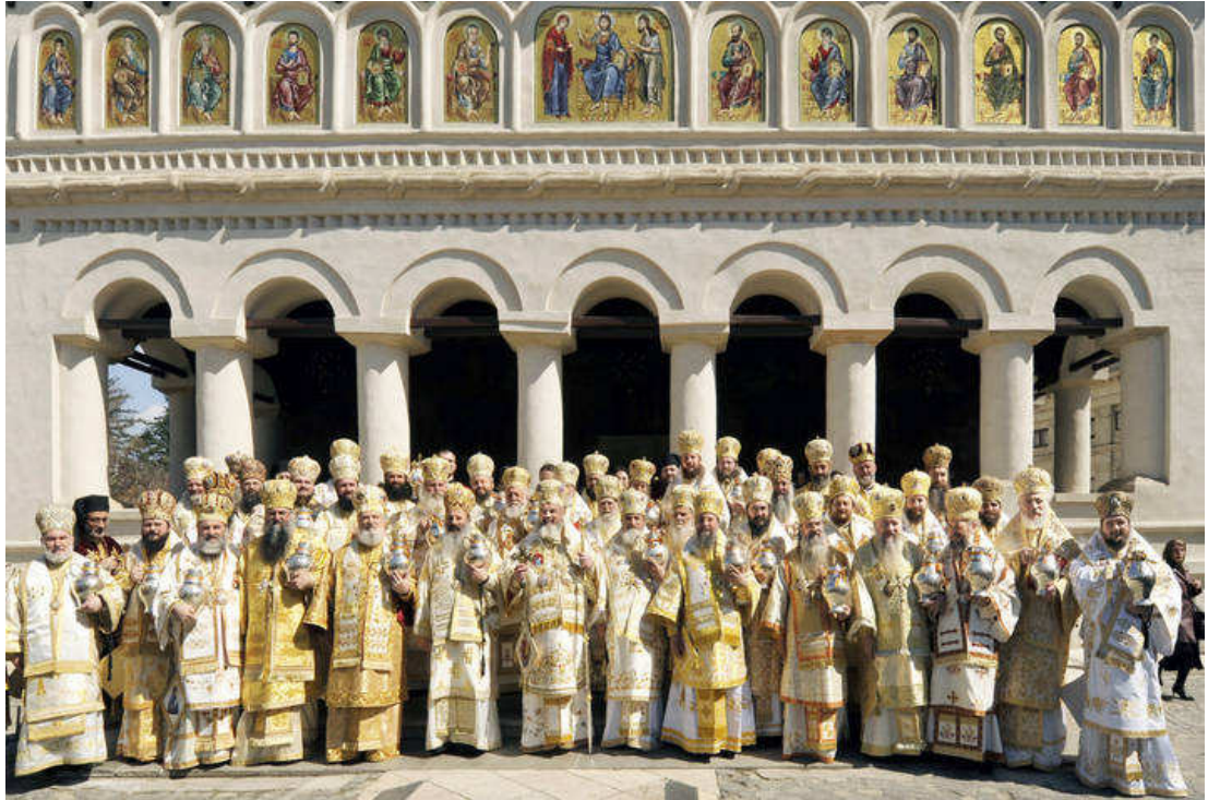
P.F. Sa Daniel împreună cu membrii Sfântului Sinod