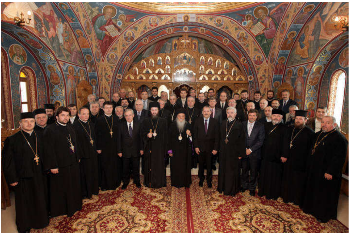
Membrii Adunării Eparhiale (2011)

Biroul de presă al Episcopiei Ortodoxe a Maramureșului și Sătmărilor