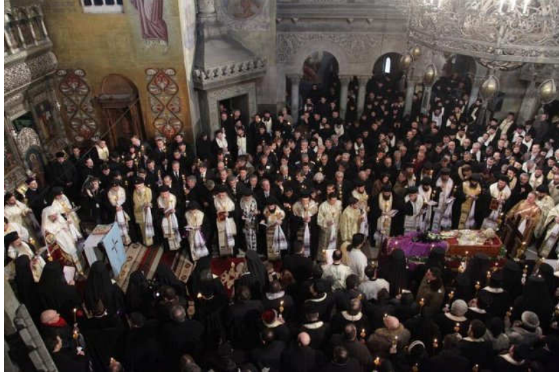
Moment de slujbă al înmormântării Î.P.S. Mitropolit BARTOLOMEU