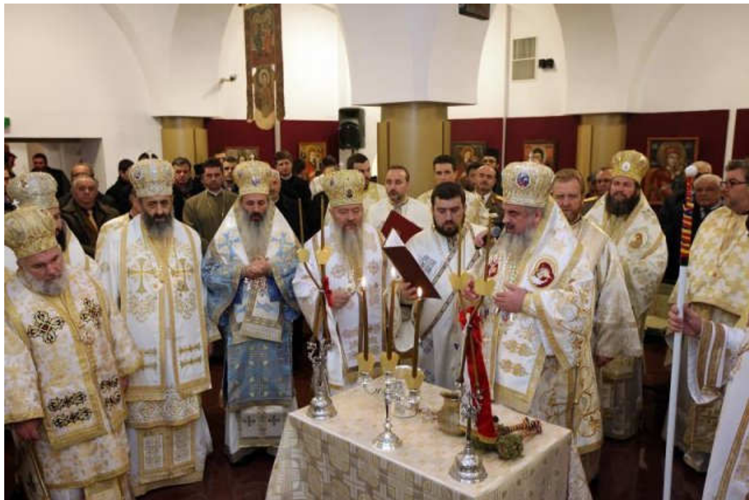
Imagini de la slujba de sfințire a muzeului mitropolitan