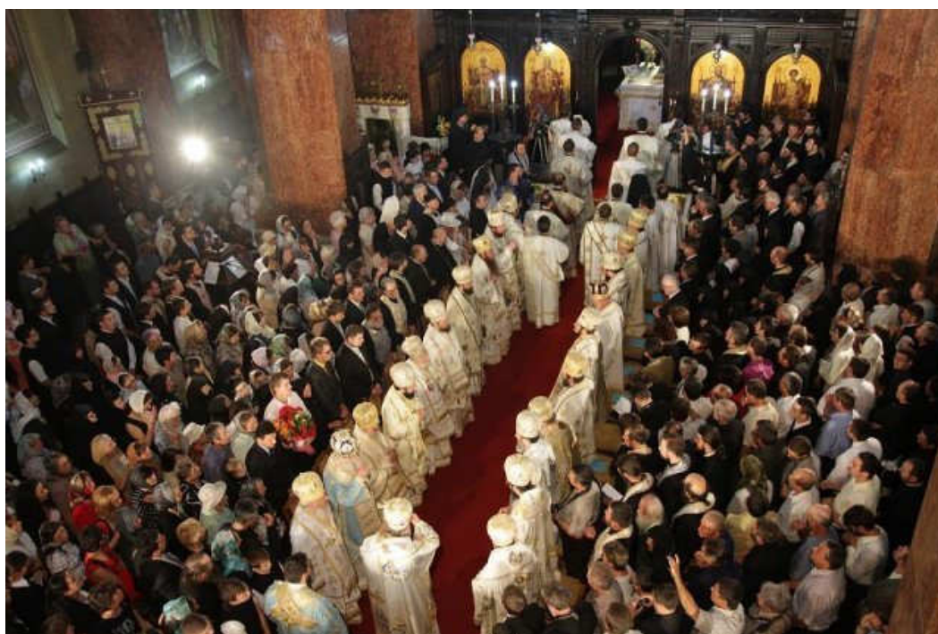
Momente solemne de la Catedrala arhiepiscopală din Alba Iulia (5 iunie, 2011)