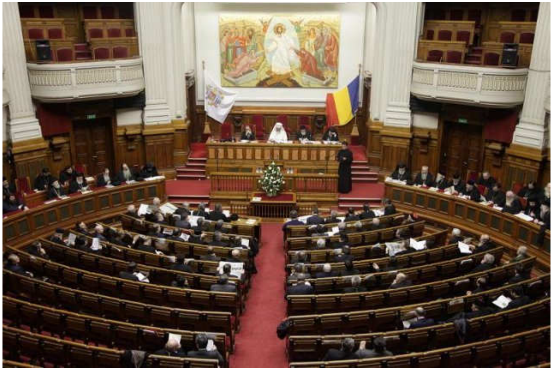
Moment din cadrul ședinței solemne a Sfântului Sinod (Joi, 18 mai 2011)