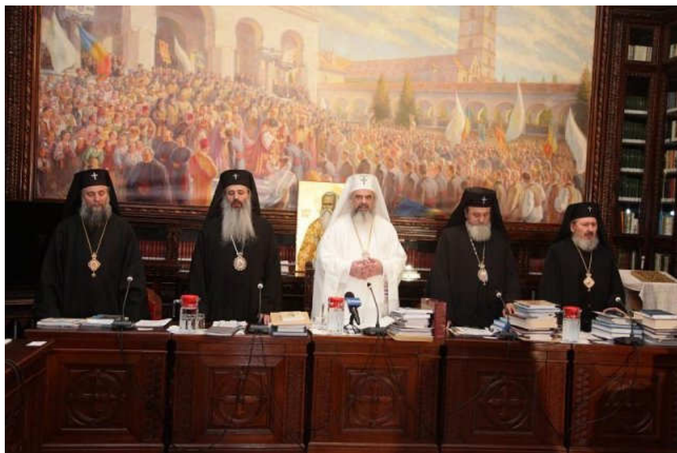
Înainte și la început de ședință a Sfântului Sinod (16 februarie 2011)