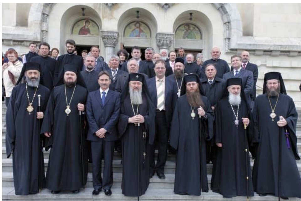
Adunarea eparhială mitropolitană a Mitropoliei Clujului, Albei, Crișanei și Maramureșului